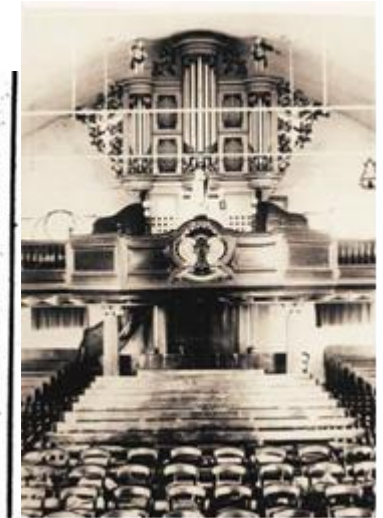
Kerk interieur voor 1951 het orgel met orgelschild