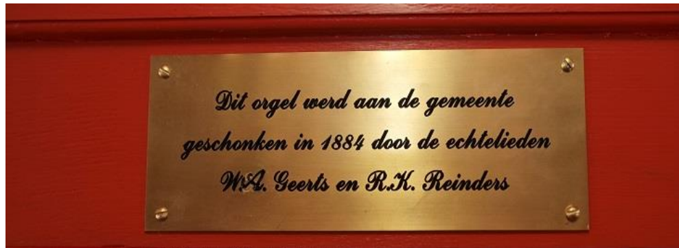
Het naambordje boven de speeltafel.

In februari 2018 is bij de viering van het 275 jarig bestaan een plaatje met de namen van de schenkers op het orgel aangebracht.