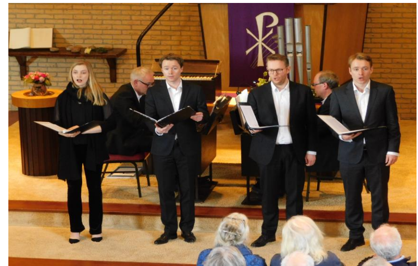
Ook hebben zij op twee kofferharmoniums een kwartet zangers begeleid bij het zingen van Folksongs en Hymnes.